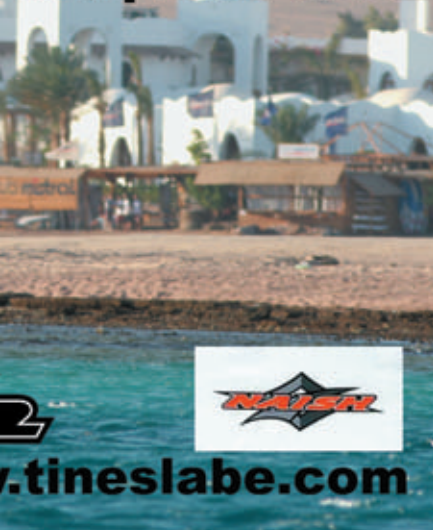
La vista, mozzafiato, di cui si gode, surfando al largo e guardando la spiaggia di Dahab

WINDSURFING FREESTYLE CAMP - 9 Aprile 2006