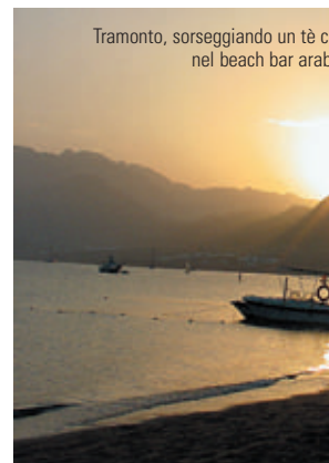
Tramonto, sorseggiando un tè con menta nel beach bar arabico