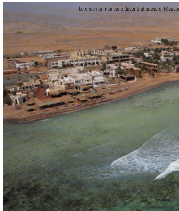
Le onde non mancano davanti al paese di Maasbat

Ma il tutto armoniosamente fuso in una tranquillità totale, rotta soltanto dai richiami dei tanti "butta dentro" dei vari locali e dal vociare dei molti turisti per lo più tedeschi e svizzeri, ma anche inglesi,