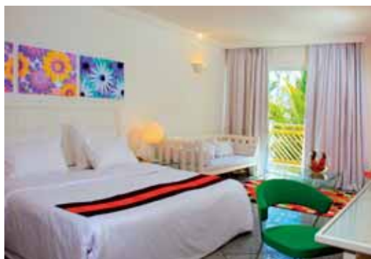
Camera standard Indian Resort