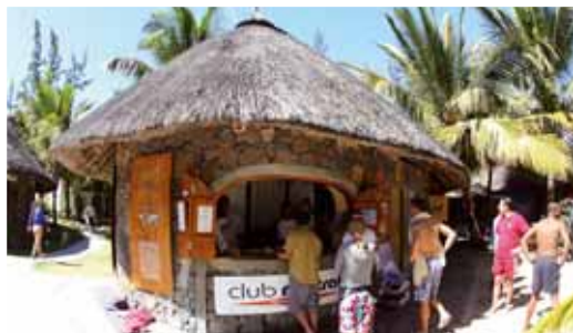
Club Mistral / Skyrider Center