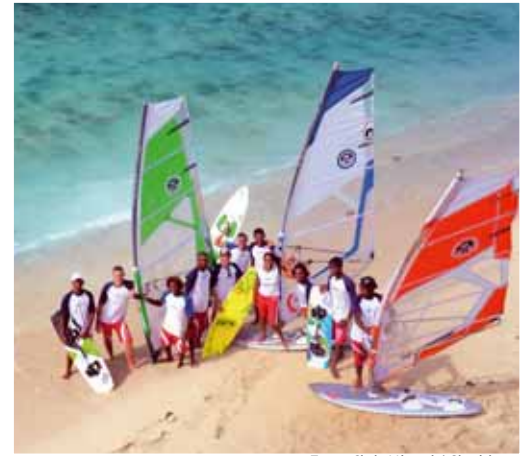
Team Club Mistral / Skyriders