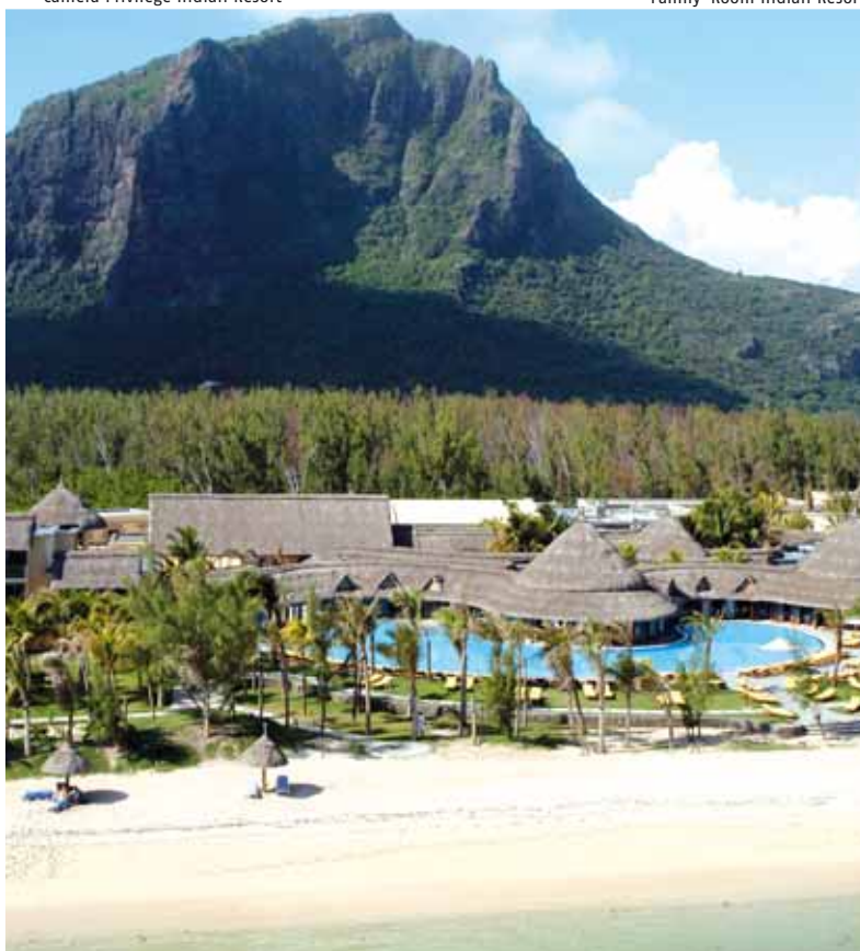
Piscina Indian Resort

Per ulteriori informazioni visitate i nostri siti !