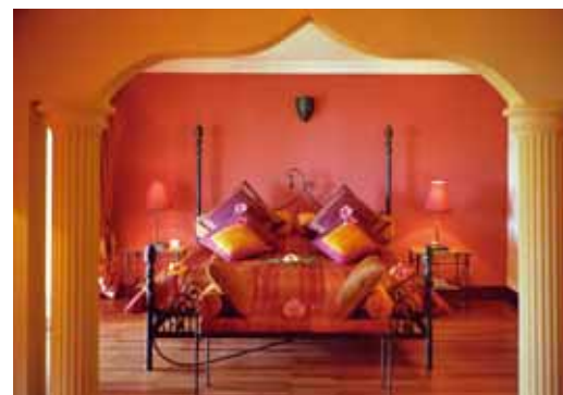
Family-Room Indian Resort