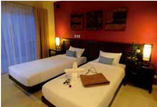
7 Stones Superior Room