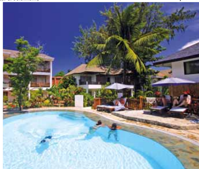
Bungalow + Pool Pinjalo Villas

Distanza dal centro surf, kite: 30 minuti a piedi, 5 - 7 in moto taxi (triciclo) per circa 50 centesimi; la fermata del taxi è a pochi metri dalle Pinjalo Villas.