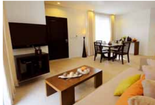
7 Stones Junior Suite