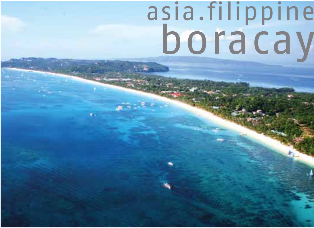
Davanti la famosa White Beach e dall'altra parte dell'Isola la Bulabog Beach (Spot windsurf + kite)