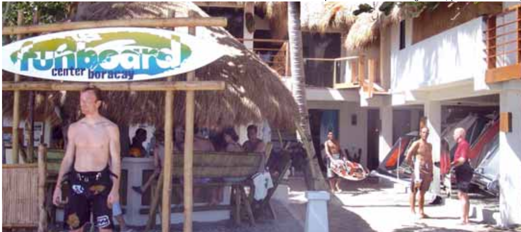
Funboard Center Boracay