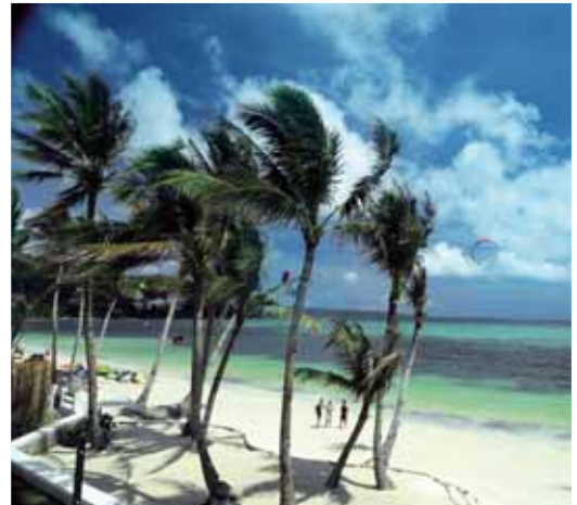
Blick vom Hotel 7 Stones