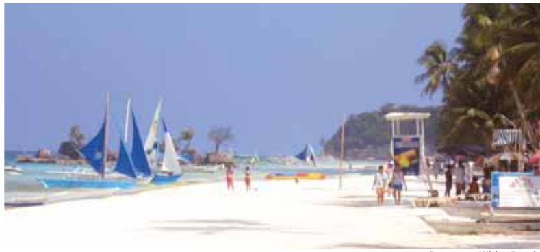
Boracay - White Beach