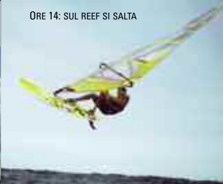
ORE 14: SUL REEF SI SALTA

affinare la propria tecnica tra le onde in grande tranquillità.