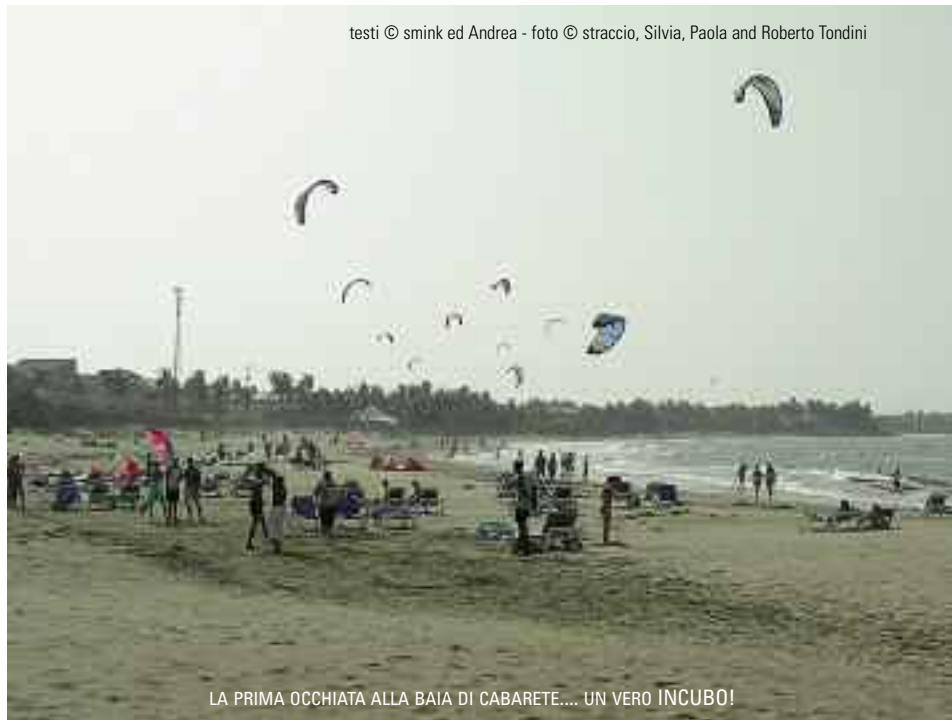
testi © smink ed Andrea

Meta di numerosi turisti, la Repubblica Dominicana è principalmente famosa nel mondo per la sua capitale Santo Domingo, per le città di Punta Cana, Puerto Plata, Samaná (la scorsa estate tutti i tour operator locali cercavano di portarci a vedere dal vivo l'Isola dei Famosi, cosa di cui personalmente non me poteva fregare di meno...) e l'isola di Saona, per le loro famosissime spiagge bianche e il mare turchese, mentre Cabarete è situata sulla costa settentrionale a circa 35 km da Puerto Plata,