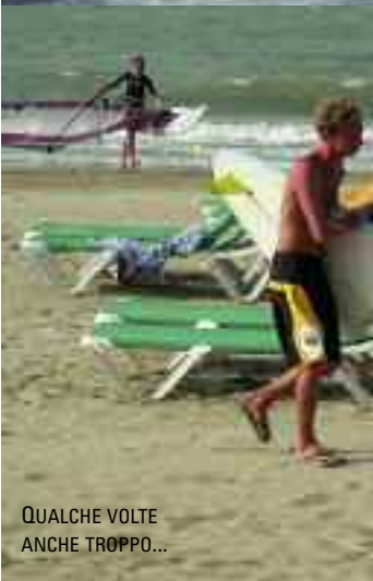
QUALCHE VOLTE ANCHE TROPPO...