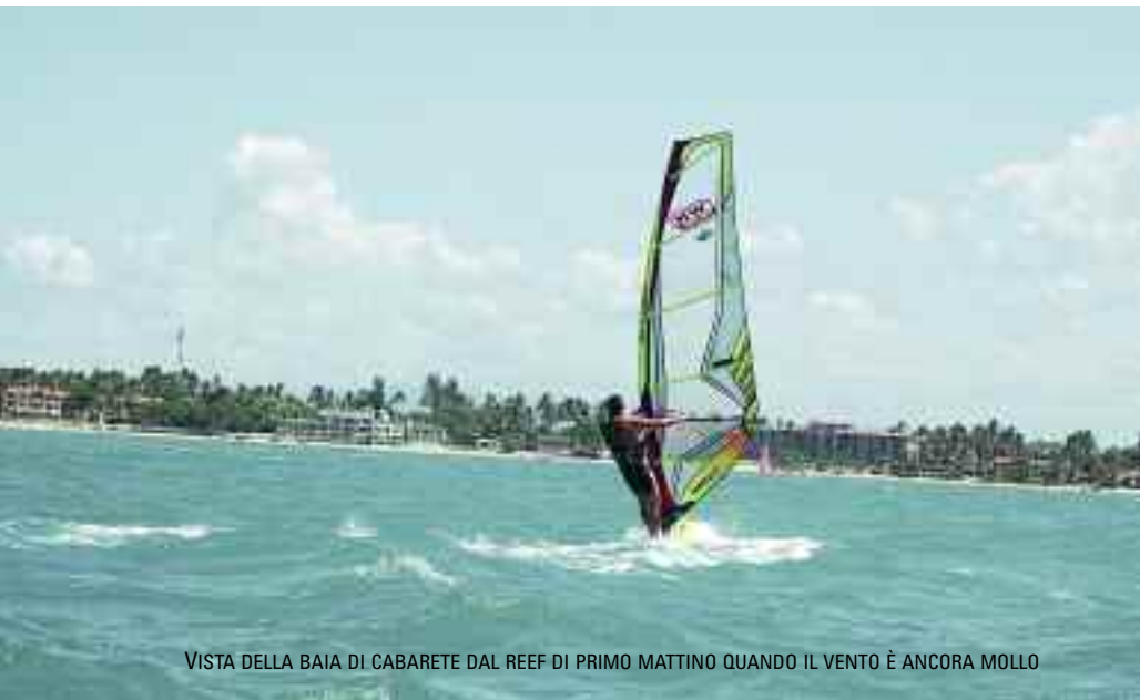
VISTA DELLA BAIJA DI CABARETE DAL REEF DI PRIMO MATTINO QUANDO IL VENTO È ANCORA MOLLO