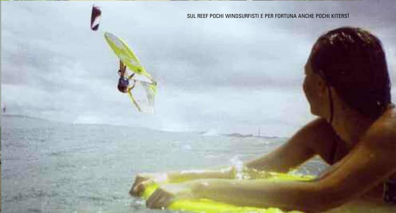
SUL REEF POCHI WINDSURFISTI E PER FORTUNA ANCHE POCHI KITERS!