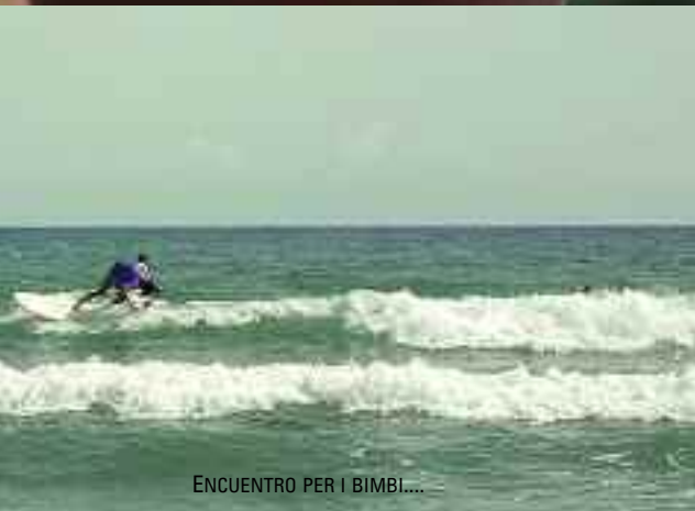
ENCUENTRO PER I BIMBI....