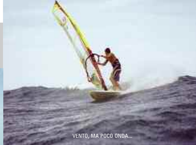
VENTO, MA POCO ONDA...

Volete fare i turisti sul serio?! Non potete perdervi una gita di due giorni all'isola di Saona, situata nell'estremo sud dell'isola: i vari tour operator lungo la strada principale di Cabarete ve la organizzeranno senza problemi. Altra meta consigliata, un po' più vicina e consigliabile a chi non si vuol perdere neanche un soffio di vento, sono le grotte di Cabarete dove a 25 metri di profondità potrete fare il bagno in vasche d'acqua calde in compagnia dei pipistrelli.