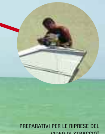
PREPARATIVI PER LE RIPRESE DEL VIDEO DI STRACCIO!