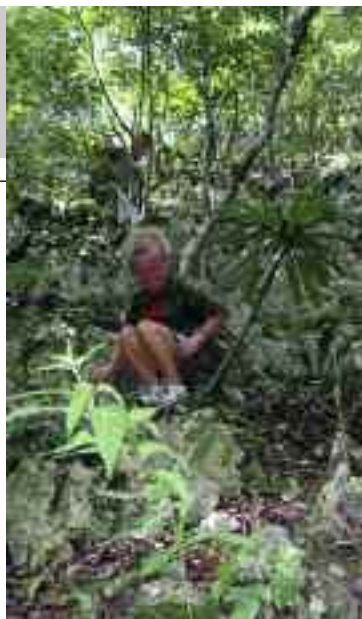
Alla ricerca delle grotte di Cabarete... un'escursione per molti, ma non per tutti!

Se si vuole invece fare surf da onda a playa Encuentro, bisogna svegliarsi pre-