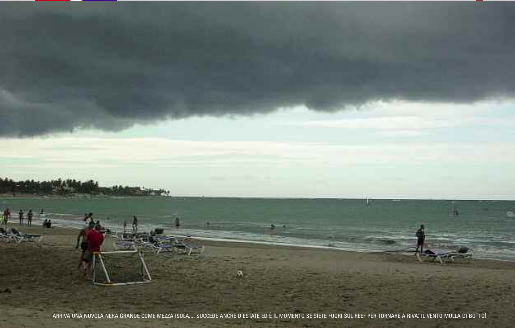
ARRIVA UNA NUVOLE NERA GRANDE COME MEZZA ISOLA.... SUCCEDA ANCHE D'ESTATE ED È IL MOMENTO SE SIETE FUORI SUL REEF PER TORNARE A RIVA: IL VENTO MOLLA DI BOTTO!