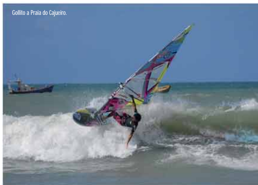
Gollito a Praia do Cajueiro.