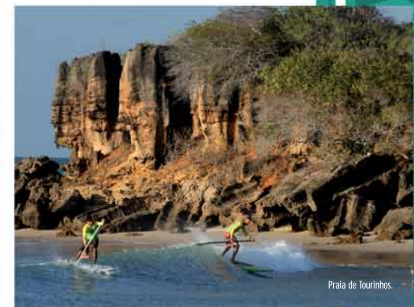
Praia de Tourinhos.