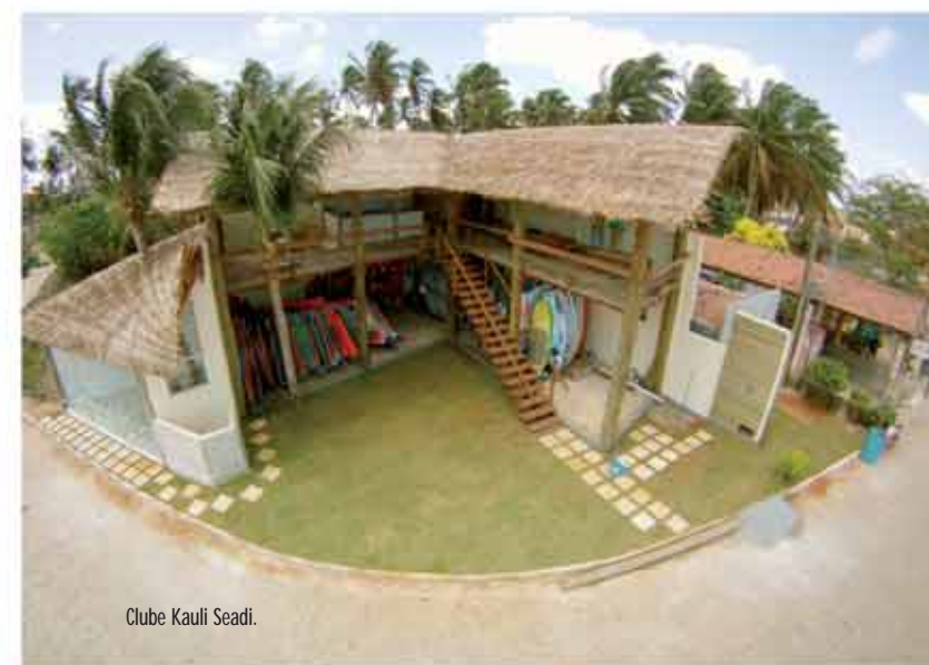
Clube Kauli Seadi.